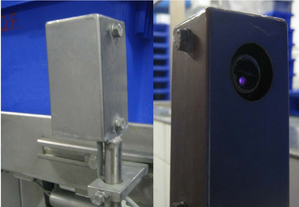
Figuur 9 afschermingfotocel