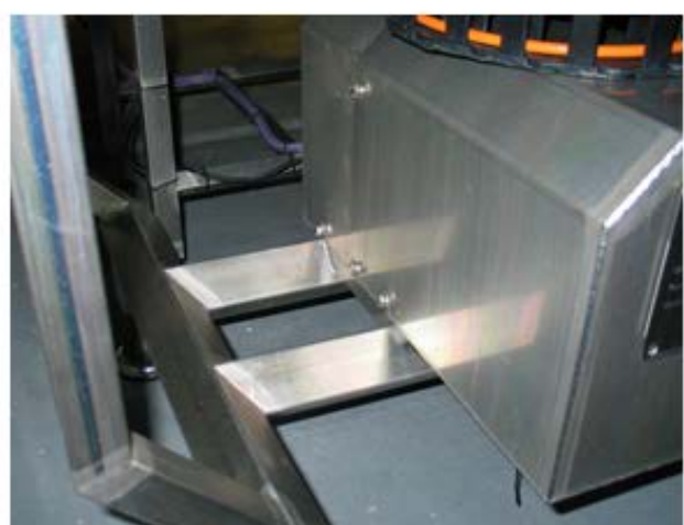
Figuur 8 Motorbehuizing