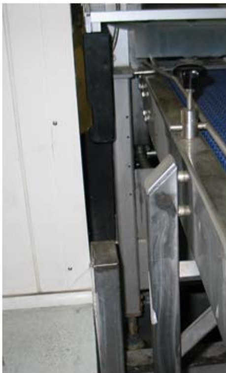
Figuur 3 Afstandsbussen bij staanders en schuine kant bovenop.