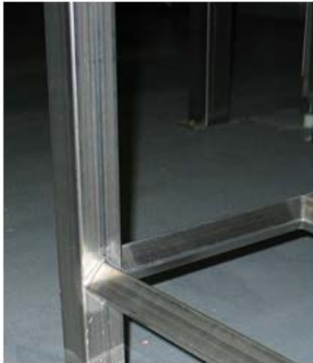
Figuur 1 Schoor- en dwarsverbindingen onder 45° Ronde dwars verbindingen zijn toegestaan.