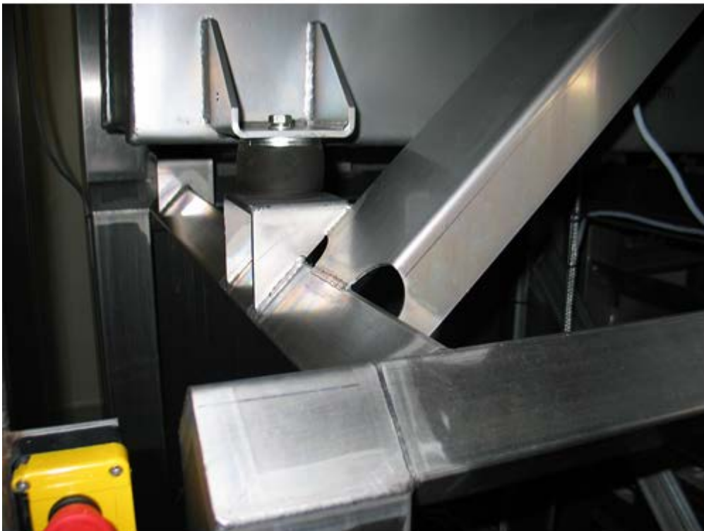
Figuur 10 Opengewerkte steun