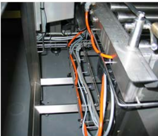
Figuur 7 kabelgeleiding