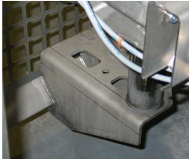
Figuur 2 Lassen volledig afgelast en open structuur steun